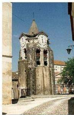
Aspecto geral da torre da Igreja, e sua envolvente. De salientar o desnível acentuado da torre, decorrente das vicissitudes dos afloramentos termais. 3

“A Igreja de Nossa Senhora do Pópulo é um exemplar de referência da arquitectura religiosa nacional, característica do período pré-manuelino. Dotada de uma torre sineira de cúpula octogonal com quatro mostradores de relógio, é na sua fachada que podemos encontrar um baixo relevo de Nossa Senhora do Pópulo.