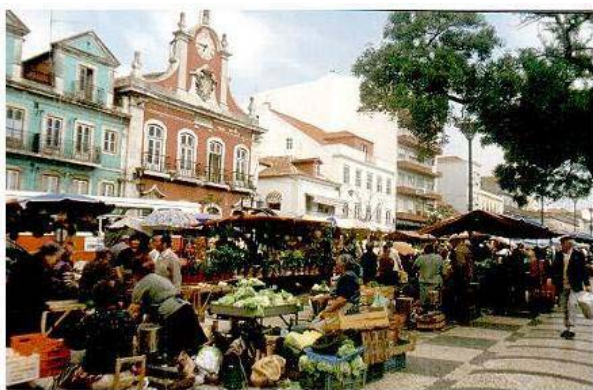
Aspecto actual da Praça da República, com o seu mercado diário 1

“Desde 1883 que os pregões das vendedoras de frutas e legumes ecoam pela Praça da República, em Caldas da Rainha. A calçada portuguesa de basalto negro sobre fundo branco é diariamente coberta pelos mais variados produtos frescos, como frutas, legumes, queijos, doces e flores e constitui pólo de atracção do turismo caldense.” 65