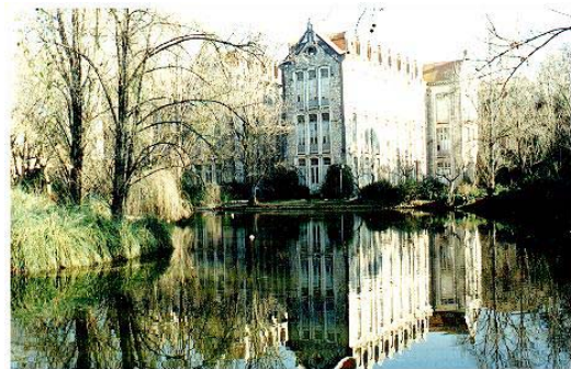
Enquadramento arquitectónico dos pavilhões edificados nos finais do século XIX por Rodrigo Berquó. 1

Os Pavilhões do Parque, actualmente ocupados com algumas instituições, foram construídos a mando de Rodrigo Berquó com o intuito de servir um novo edifício hospitalar. A morte de Berquó e o fim da monarquia não permitiram a conclusão deste projecto mas ainda hoje constituem parte importante do Parque D. Carlos I.” 65